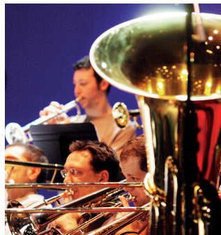
© Martin Argyroglo Callias Bey – CNSMDP